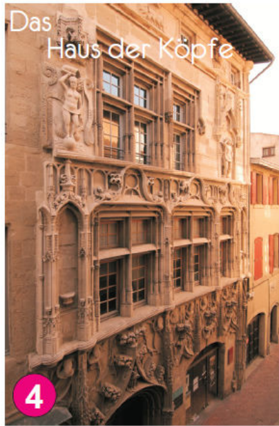
Das Haus der Köpfe

valencetourisme.com OFFICE DE TOURISME ET DES CONGRÈS COMMUNAUTÉ D'AGGLOMÉRATION VALENCE AGGLO SUD RHÔNE-ALPES